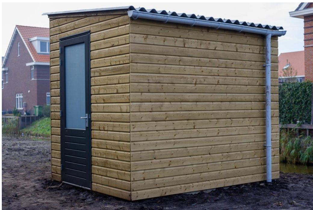
Voorbeeld van een buitenberging

roosters in de gevel natuurlijk geventileerd. Het is belangrijk deze ventilatieopeningen volledig vrij te houden, om te voorkomen dat er een vochtprobleem ontstaat, met schimmelvorming tot gevolg. In de berging heerst hetzelfde klimaat qua temperatuur en luchtvochtigheid als buiten. De hemelwaterafvoer van de bergingen worden geloosd op een grindkoffer waarbij het water vertraagd zal worden opgenomen in de grond