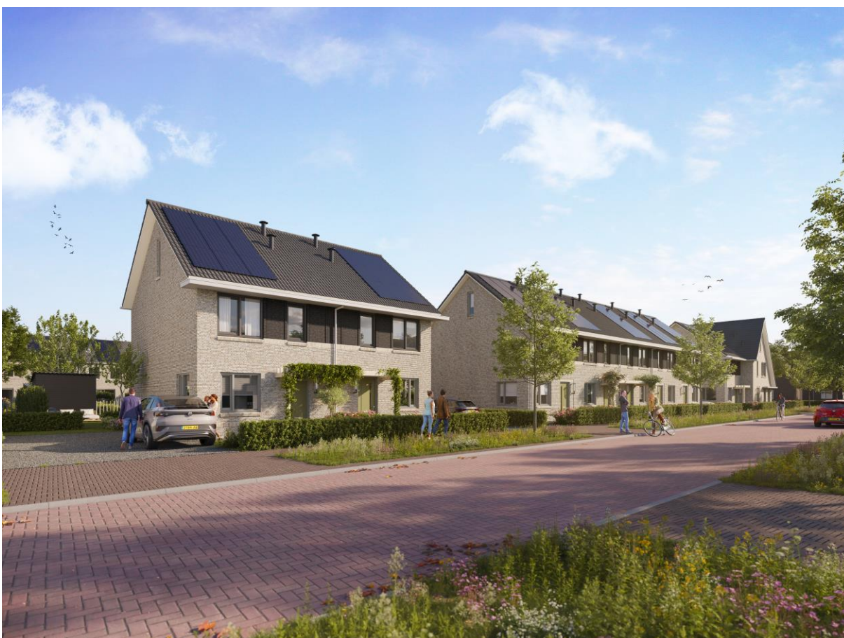
Artist Impression – Blok C t/m E – bouwnummers 15 t/m 23