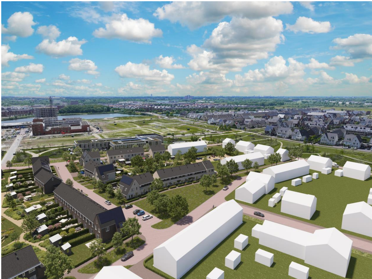
Artist Impression – “Vogelvlucht”

De woning wordt bezemschoon opgeleverd. Het sanitair, tegelwerk en beglazing worden voor oplevering schoongemaakt. Het bij de woning behorende terrein wordt ontdaan van bouwvuil en puinresten.