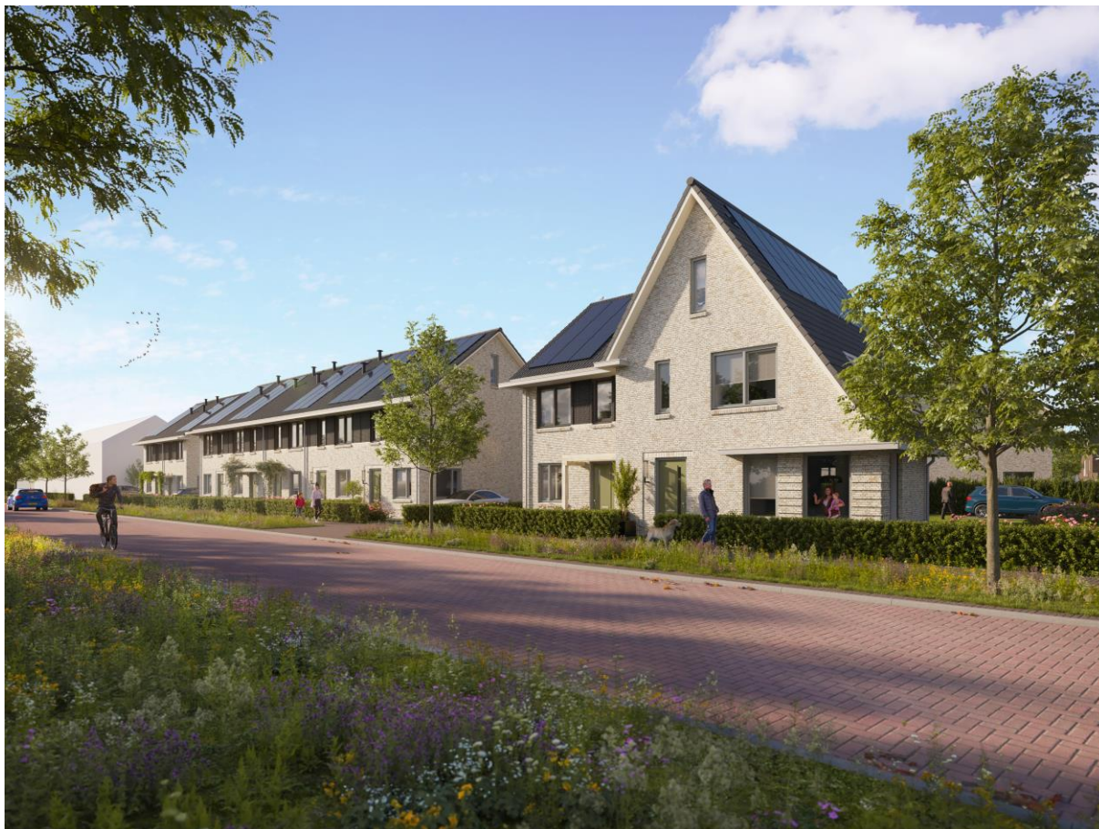
Artist Impression – Blok C t/m E – bouwnummers 15 t/m 23

De beglazingskit vraagt onderhoud, omdat deze verouderd en krimpt. Indien bij eventuele schade-meldingen aan de kozijnen en-/of beglazing blijkt dat er geen/onvoldoende onderhoud is gepleegd, kunnen uw garantierechten in gevaar komen. Wij verwijzen voor de onderhoudsvorschriften van de beglazingskit naar het bewonersinformatie- boekje, deze ontvangt de verkrijger bij de oplevering van de woning.