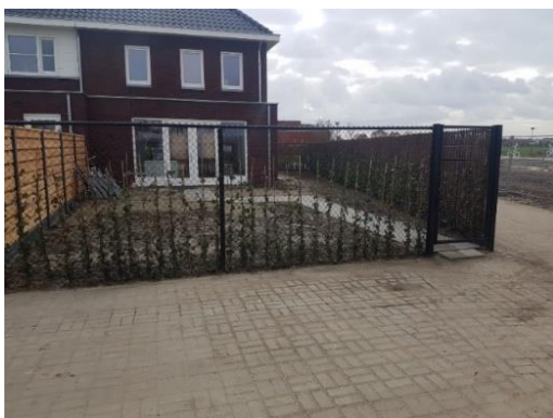
Voorbeeld van gaashekwerk v.v. bovenbuis met Hedera.

Op de hoeken van het perceel worden stalen buispaaltjes geplaatst ten behoeve van de aanduiding erfgrenzen. Voor het hekwerk en de begroeiing geldt een instandhoudings-verplichting. U dient zelf het onderhoud van de haag uit te voeren.