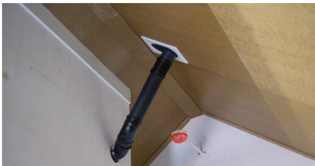
Voorbeeld van een dakdoorvoer-inpandig

Er worden Prefab kunststof dakdoorvoeren ten behoeve van Warmteterugwinning Unit (WTW) en rioolontluchting op het dak geplaatst.