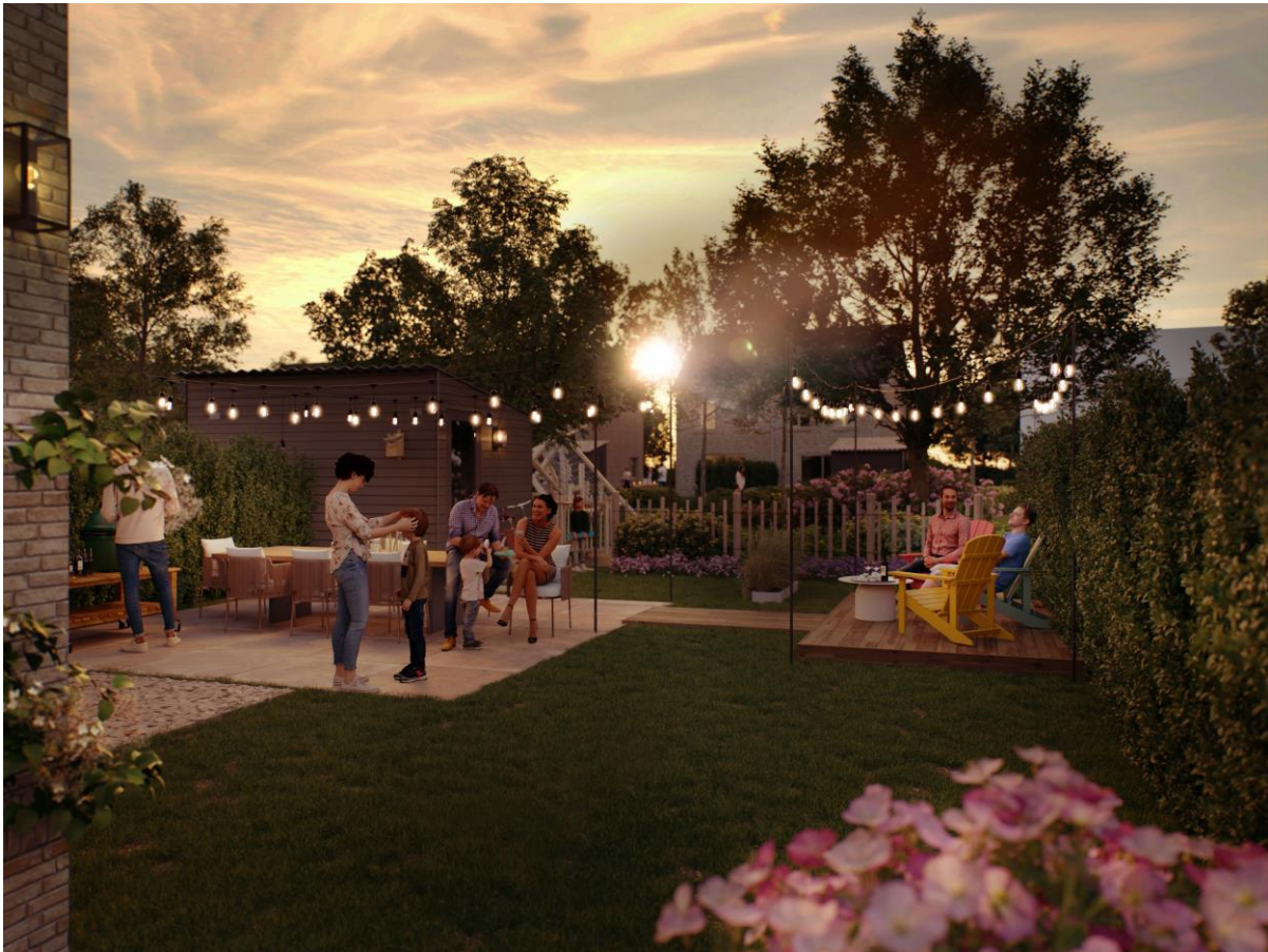
Artist Impression - Achtertuin