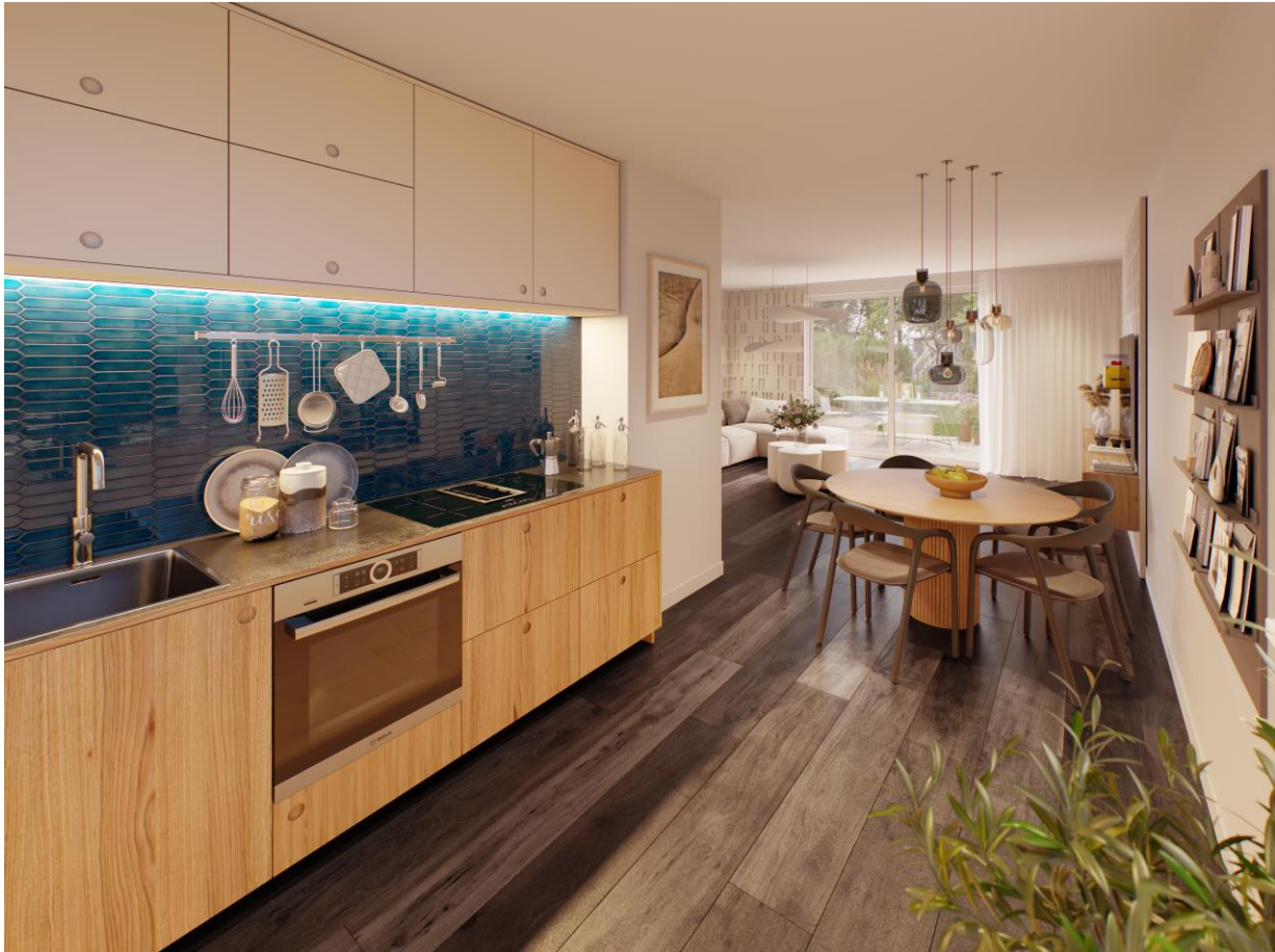
Artist Impression – Interieur keuken - woonkamer

WTW staat voor warmteterugwinning , dit is een methode voor hergebruik van warmte uit de afvoerlucht en het afvoerwater. Deze warmte wordt gebruikt als voorverwarming, bijvoorbeeld voor het voorverwarmen van ventilatielucht. Hierbij wordt alleen de warmte uit de afvoerlucht hergebruikt.