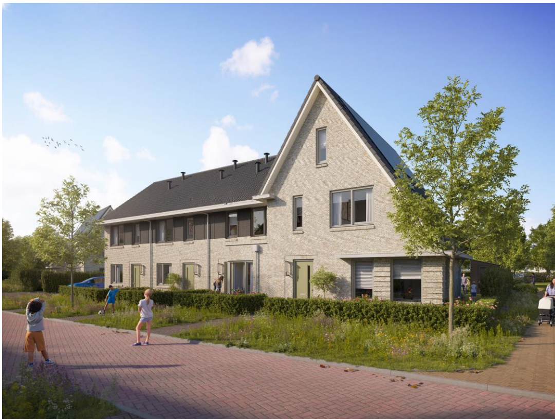
Artist Impression – Blok B – bouwnummers 11 t/m 14

De wanden worden niet voorzien van behang. De wanden worden behangklaar afgewerkt met uitzondering van meterkasten, warmtepomp ruimte en de installatiezone op zolder, deze worden niet afgewerkt. De uitgangspunten voor behangklaar zijn als volgt: voor de wanden geldt dat kleine oneffenheden in de vorm van gaatjes, bultjes, spaanslagen zijn toegestaan. Behangklaar wil ook zeggen dat ervan uitgegaan wordt dat er na oplevering nog een verdere afwerking door de bewoner gaat plaatsvinden. Verdere afwerkingen kunnen bijvoorbeeld behang of een sierpleister zijn. Let goed op wat voor behang u koopt, want niet alle behangsoorten zijn geschikt. Een wand die behangklaar is gemaakt is onvoldoende vlak om te kunnen sausen.