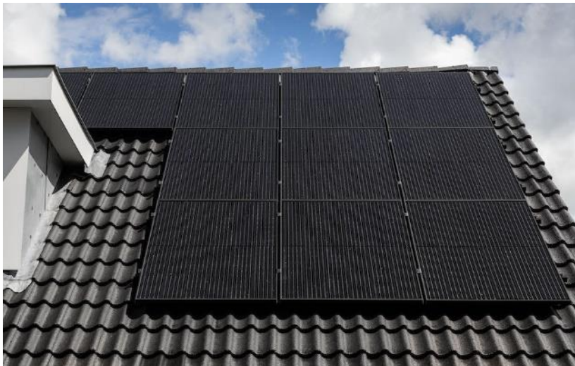
Voorbeeld van PV-panelen

De woning wordt tevens voorzien van een PV systeem op het dak. Het PV systeem bestaat uit een serie zonnepanelen aangesloten op een omvormer die de opgewekte energie omzet naar wisselstroom die gebruikt wordt voor energieverbruik van de warmtepompinstallatie en ventilatiesysteem. Het PV systeem wordt uitgevoerd in een zogenaamd op-dak-systeem, wat betekent dat de zonnepanelen gemonteerd worden op de dakpannen. De hoeveelheid, afmetingen & positie van de PV panelen wordt definitief vastgesteld nadat de Energie prestatie berekeningen van uw woning zijn gemaakt. Het PV systeem is eigendom van de Energie exploitatie Rijswijk Buiten BV. Op elk gewenst moment kan de huurovereenkomst worden afgekocht. Voor meer informatie hierover verwijzen wij u naar de Informatie folder van Energie exploitatie Rijswijk Buiten BV welke is bijgevoegd bij de verkoop brochure.